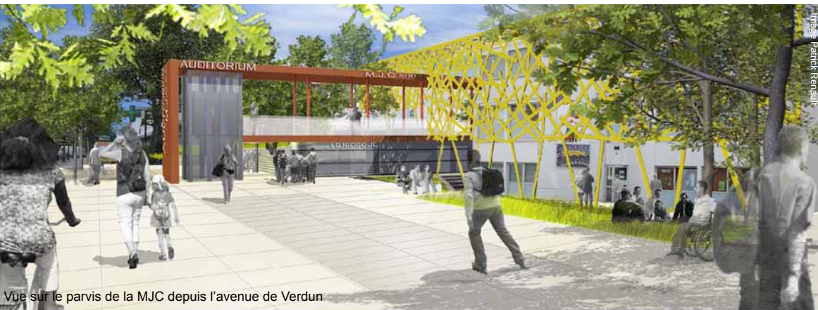
Vue sur le parvis de la MJC depuis l'avenue de Verdun