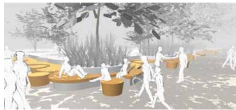
Le bancs des «palabres»