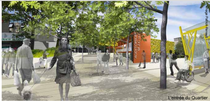
L'entrée du Quartier

MAÎTRE D'OEUVRE Architecte Mandataire Edmond Deturche Architecte d'opération : Frédéric Moirou Paysagiste: Équinoxe Paysages Concepteur Lumière: Le Point Lumineux BET VRD : BETREC