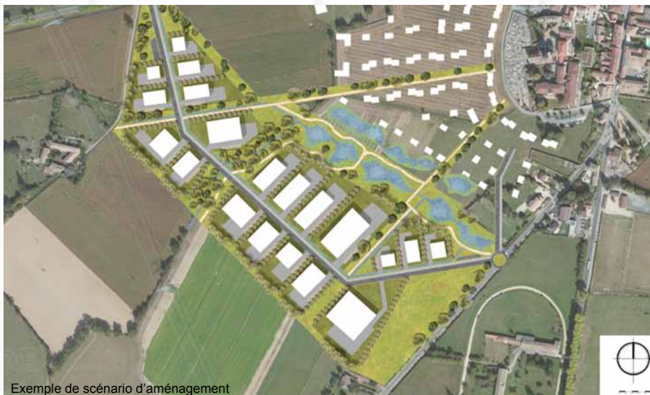
Exemple de scénario d'aménagement